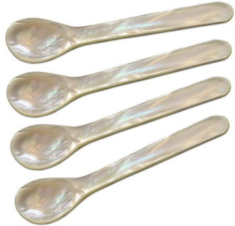
Cuillères en nacre