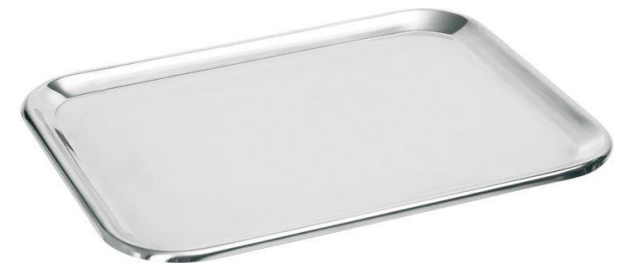
Plateau de présentation 31x23