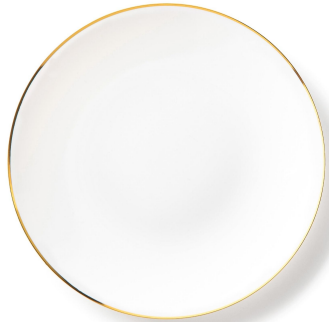
Assiettes blanches à liseré doré 16cm