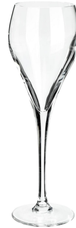
Coupe à champagne 13cl